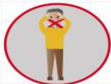
РАК ГУБЫ, ЯЗЫКА